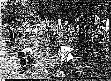
夏のキャンプでウヨロ川観察に熱中