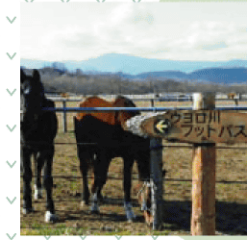
オーシャンファーム