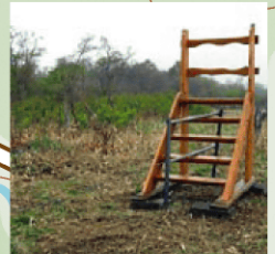
牧場の柵を越える階段