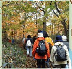
森の中を歩くコース

ウヨロ川周辺には、アイヌ語地名が色々と残されています。 <カツケンハツタリ、タッコブ、メム>