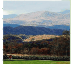
遠くに見える景色も醍醐味